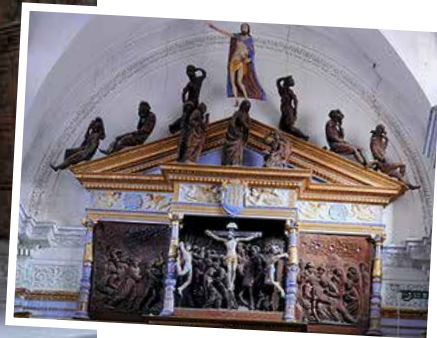
Ci-dessus et à droite : l'église Saint-Véran à Utelle. En bas, la chapelle des Pénitents Blancs à Saint-Martin-Vésubie.