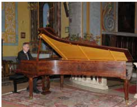
Le piano, star du festival.