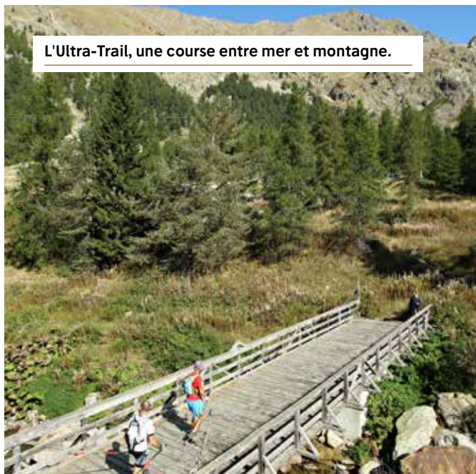
L'Ultra-Trail, une course entre mer et montagne.

- 8h30 : départ du 30 km. Saint-Martin-Vésubie. - 10h45 : estimation du premier arrivant du 30 km, Saint-Martin-Vésubie. - 14h30 : podium des 30 km. Saint-Martin-Vésubie. - 15h : arrivée du dernier coureur 30 km. Saint-Martin-Vésubie.