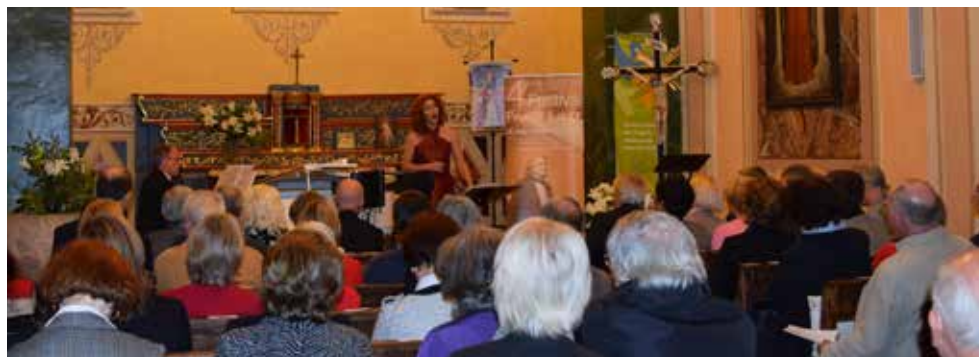
L'ouverture du festival aura lieu en l'église Saint-Antonin.

Parking assuré pour l'ensemble des concerts.