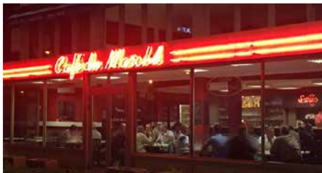
Le Café du Marché est ouvert la nuit pour les travailleurs du MIN.

Café du Marché MIN Saint-Augustin, Nice. 04.93.71.46.97. 06.64.93.65.66.