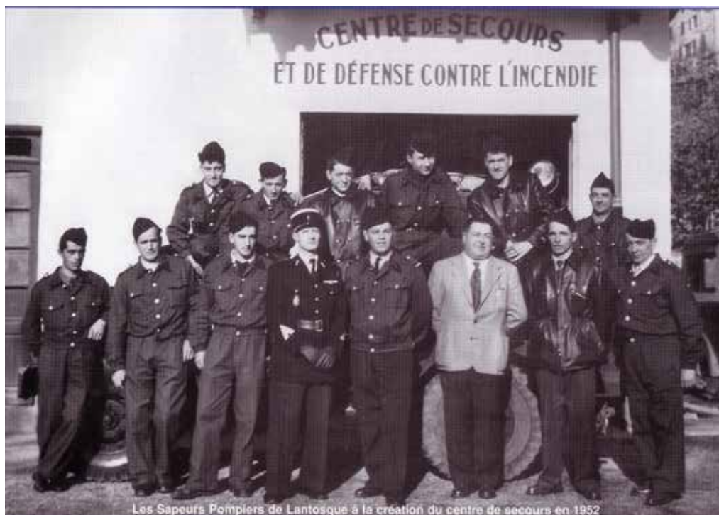
Les Sapeurs Pompiers de Lantosque à la création du centre de secours en 1952