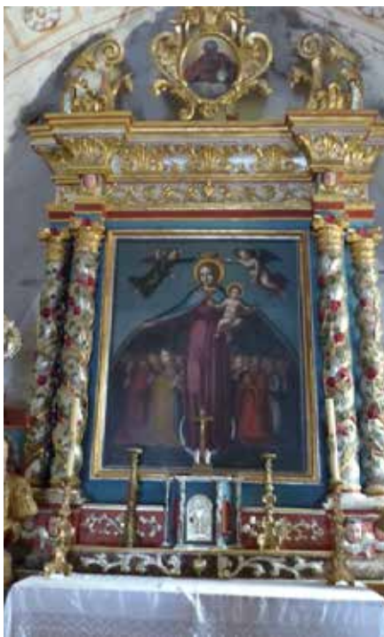
Le retable de Jean Rocca dans la chapelle des Pénitents de Clans.

Jean entièrement repeinte par Moya ainsi que l'atelier expérimental de la villa les Vallières. «Depuis 1996, on y sensibilise les populations du moyen et du haut pays niçois à l'art contemporain», poursuit Laetitia Combe qui enchaîne sur la découverte extra muros du village : «Après en avoir admiré les beautés patrimoniales, pourquoi ne pas découvrir ses alentours? Pour ce faire, Clansois et touristes ont la possibilité de louer des VTT électriques (lire l'encadré)».