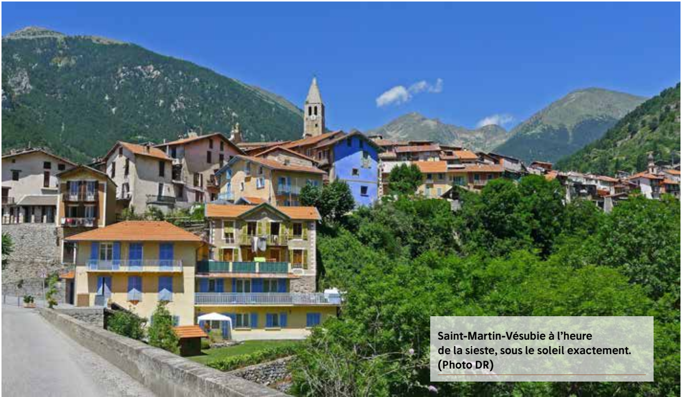
Saint-Martin-Vésubie à l'heure de la sieste, sous le soleil exactement.

J uillet ! Le temps de la lumière, de l'insouciance, des vacances bien méritées. Le soleil tape fort mais l'on est bien, assis à l'ombre du pignon de la vieille maison... On passe alors le temps avec des amis, à papoter, à regarder le Tour de France à la télé, à faire la sieste. Le soir venu, le barbecue crépite, le pastis puis le rosé coulent dans les verres, on s'affaire à préparer les petits farcis et la polenta qui vont régaler la famille. Franchement, a-t-on besoin d'aller très loin pour être bien ? Non, bien sûr ! Pas étonnant que les vacanciers et les citadins viennent dans notre canton pour retrouver le calme qui leur manque tant, en bas, à la ville. Pour apprécier cette nature si variée qui conduit en peu de