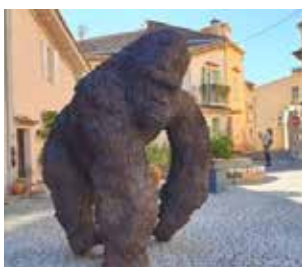
Mougins : une expo monumentale !