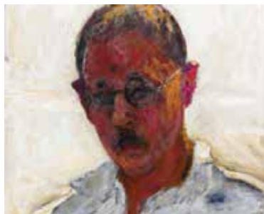
Pierre Bonnard par lui-même, détail.

Buffet, Cézanne, Chagall, Denis, Goetz, Hélion, Manguin, Marquet, Matisse, Picasso, Poliakoff, Van Dongen, Maria Helena Vieira da Silva, Vuillard : c'est une incroyable affiche sur le thème de l'autoportrait qui est proposée par