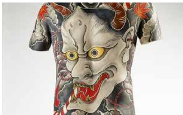
Tatouages : à la galerie de Port Lympia à Nice.