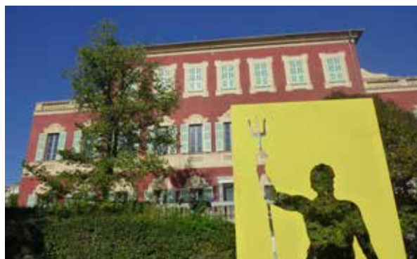
Sosno interroge l'antique sous le regard de Matisse...

Toujours à Nice, ne manquez surtout pas « Sosno squatte l'antique », expo en plein air de sculptures dans l'ancienne cité romaine de Cemenelum à Cimiez (jusqu'en janvier 2022). Entrez dans le musée archéologique où les œuvres dialoguent avec celle du passé et profitez de votre passage dans ce quartier pour visiter